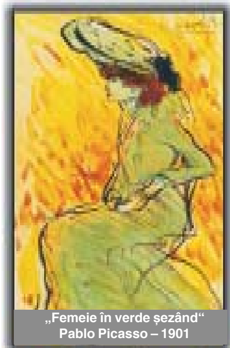
„Femeie în verde șezând” Pablo Picasso – 1901