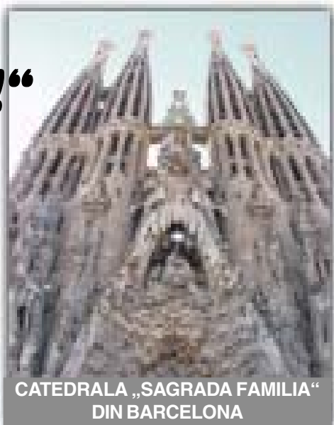
CATEDRALA „SAGRADA FAMILIA” DIN BARCELONA

Antonio Gaudi nu a fost nici măcar o clipă arhitect de case și biserici, ci un poet al formelor nedesăvârșite și neterminate, adică exact cum îi stă bine unui om. Teoreticienii arhitecturii nu au reușit să-i cuprindă opera în nici un stil cunoscut și atunci au fost nevoiți să inventeze unul, ce-i poartă numele și are un singur reprezentant.